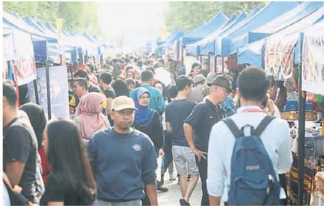
■網民炮轟隆市局在疫情時期仍不取消齋戒月市集的舉措。(檔案照)

吉隆坡市政局和聯邦直轄區部相繼在官方網站上做出否認，表明市政局沒有發出任何取消齋戒月市集的通告，聯邦直轄區部也促請公眾不要胡亂轉貼來歷不明的消息。