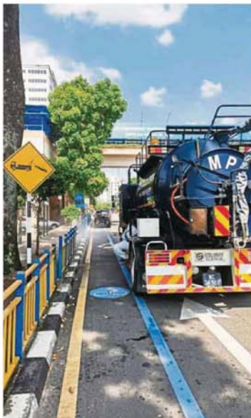
Bus stops and guard rails being disinfected by MPAJ personnel.