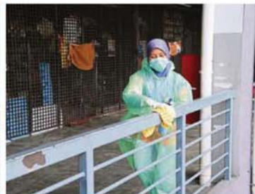
A railing being wiped at SS15 market, Subang Jaya.