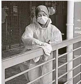
所有常被接触的表面都会进行清洗和消毒工作。