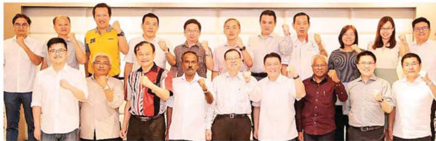
行动党霹州国盟政府推出救市配套。