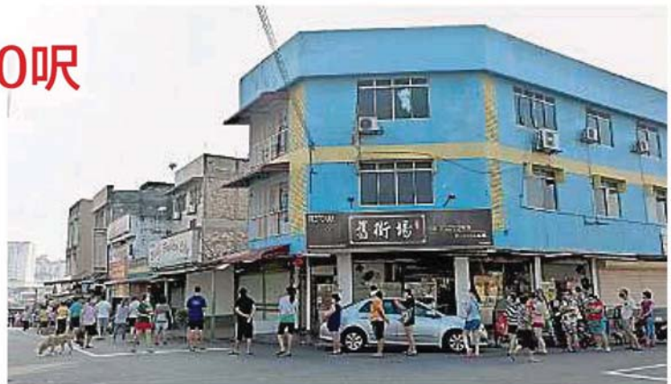
沙登新村巴刹周四上午突然显现排队人潮，从街头到街尾的人龙一度长达200呎。

他说，为了控制巴刹内的人流量，避免过度拥挤，自从实行单一进出口管控措施以来，当局尽