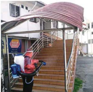
MPS sending its personnel out to disinfect public places in Bandar Baru Selangor. (Right) A lift in Serdang Villa Apartment being disinfected.