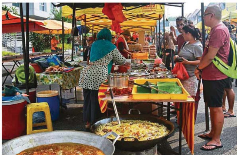
Every year Malaysians look forward to patronising Ramadan bazaars.

In 2019, it is learned that MPK earned RM415,000 from Bazaar Juadah while the one in Jalan Taiping brought in RM1mil.