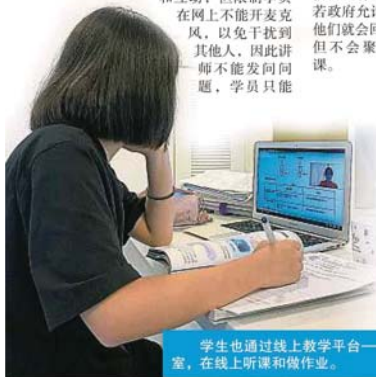
学生也通过线上教学平台——谷歌教室, 在线上听课和做作业。

他也说, 在这个众声喧哗的时代, 公众人物能在非常时期能扮演什么角色? 他希望透过公众人物的影响力传达讯息, 如告诉公众不能出去等讯息。