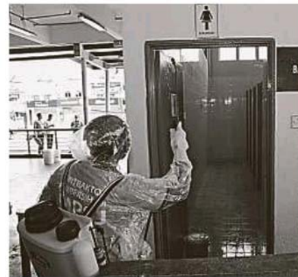
↑ 在进行消毒工作之前会先进行清理工作。