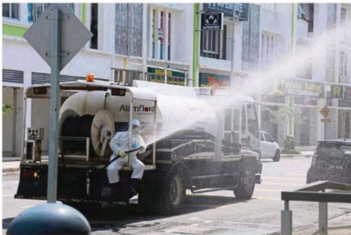
Ppj and Alam Flora conducting additional disinfection work at commercial complexes and government facilities.