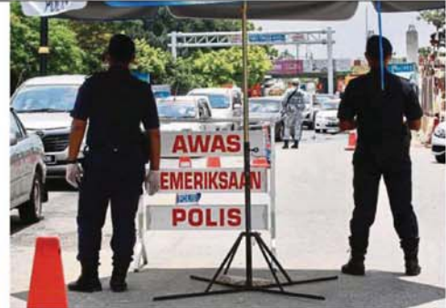
Police roadblocks at major roads in Klang are helping to ensure smooth implementation of the public sanitisation exercise.