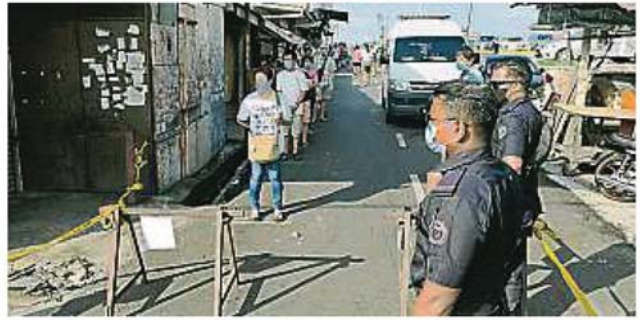
梳邦再也市议会每天早上8时派员到沙登新村巴刹站岗，管控巴刹人流量。