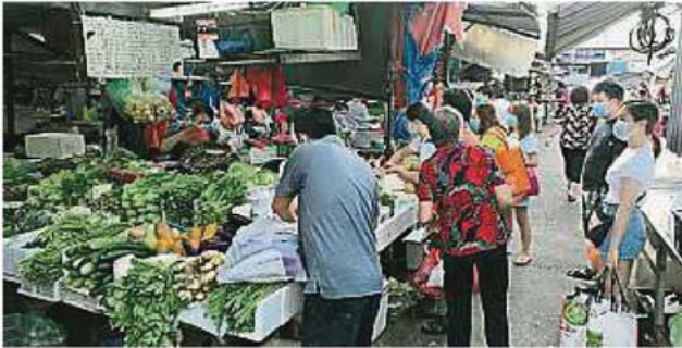
随着州政府重新允许公共巴刹从清晨6时开始营业后，沙登新村巴刹周四逐步有顾客回流，让小贩松了一口气。

Provided for client's internal research purposes only. May not be further copied, distributed, sold or published in any form without the prior consent of the copyright owner.