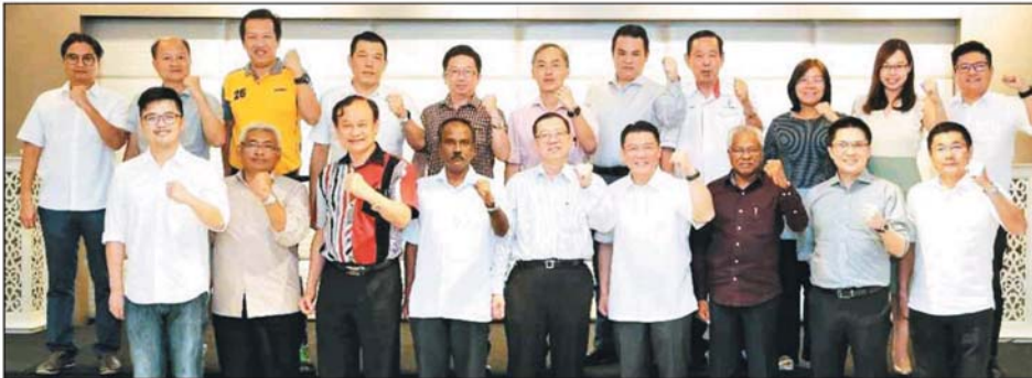
霹州行动党促请州政府立即推出振兴经济配套，挽救州内的经济市场。

续推出各自的振兴经济配套，如檳州已将数千万令吉汇入人民的银行账户，雪州政府也已祭出第二阶段的救市配套。