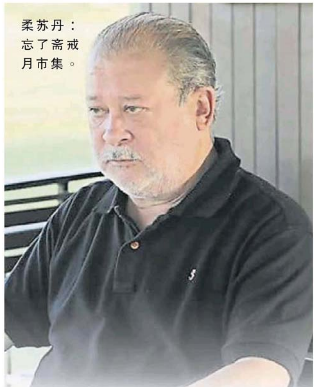
柔苏丹： 忘了斋戒 月市集。

雪兰莪州苏丹沙拉夫丁殿下周三指出，斋戒月期间的祈祷、开斋和市集，必引来群众聚集，所以很难做到社交距离，无论回教堂或街