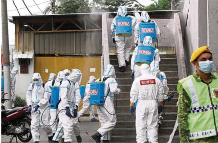
A team from the fire and rescue services being deployed to the Jalan Othman Market in Petaling Jaya.