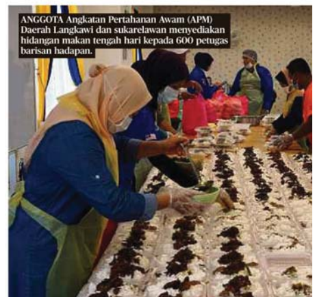
ANGGOTA Angkatan Pertahanan Awam (APM) Daerah Langkawi dan sukarelawan menyediakan hidangan makan tengah hari kepada 600 petugas barisan hadapan.