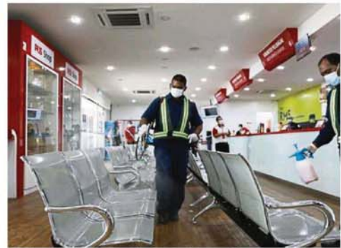
MBSA workers disinfecting the Section 14 post office as part of the city council's daily sanitisation exercise.

"We had informed the shop owners and residents that a disinfection exercise would be carried out for three days. Most of the locals gave full support by staying indoors, even the fast food outlets only began operations after our men had disinfected the area," he said.