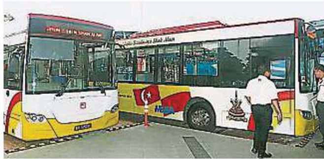
雪州政府将派出雪兰莪精明巴士，协助将从国外回国的大马人送往隔离中心。（档案照）