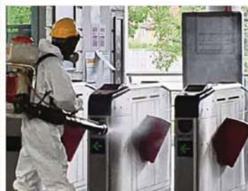
MPAJ is also disinfecting public transportation hubs within its jurisdiction.

we identified 30 hotspots in and around the market and they were given a thorough cleansing.